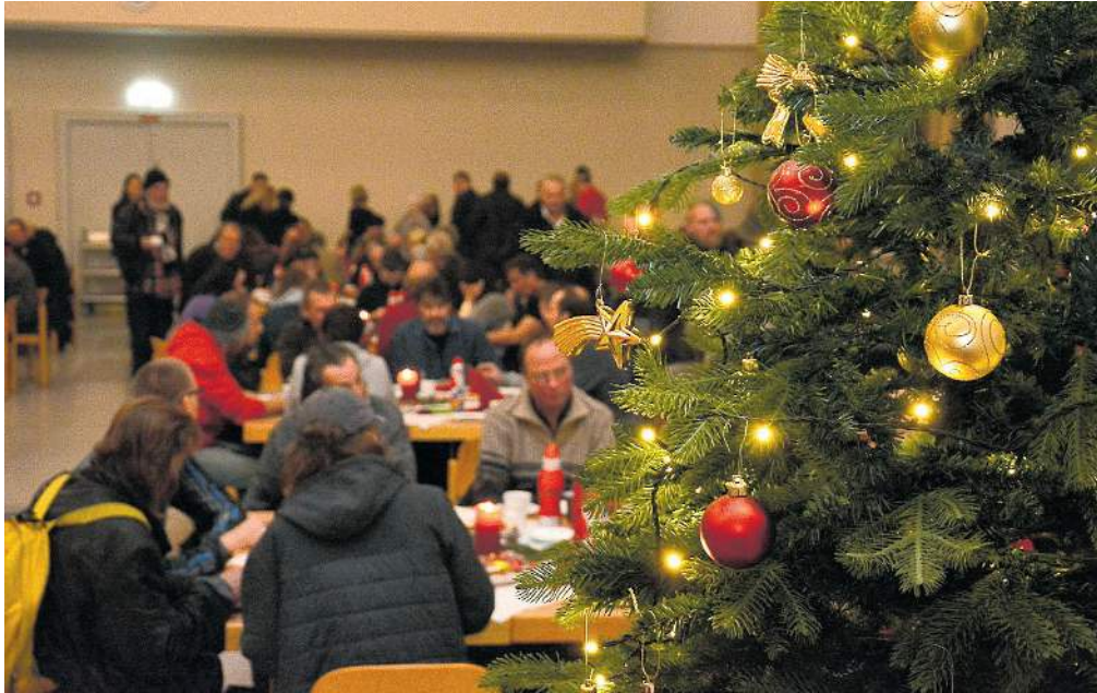
In der Gemeinschaft fühlt sich alles etwas leichter an.