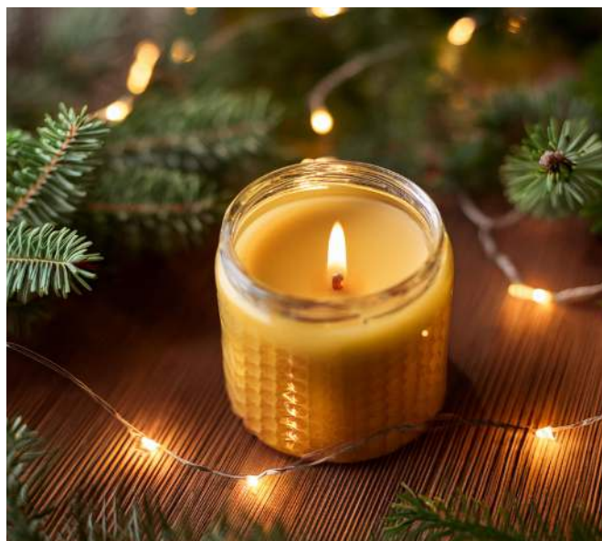
Die klassische Bienenwachskerze ist eine umweltverträgliche Alternative.

Empfehlenswert sind deswegen Bio-Weihnachtsbäume – am besten aus der Region und zu Fuß, per Fahrrad, Bus oder Bahn nach Hause transportiert. Garten- oder Balkonbesitzer können die Lebenszeit ihres Baumes verlängern, indem sie einen Topfbaum mit Wurzeln wählen, der auch nach dem Fest weiterwächst. Und wer mal etwas Anderes als den klassischen Weihnachtsbaum ausprobieren möchte, könnte sich aus Tannengrün einen Strauß oder ein Gesteck schaffen – oder sich aus Pappe und Papier eine Weihnachtsbaum-Alternative basteln.