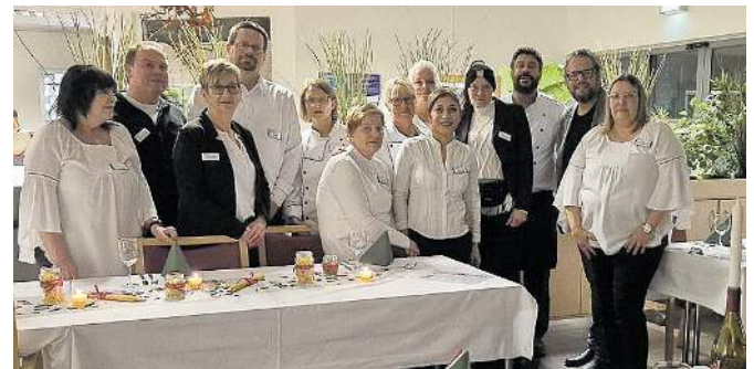
Das Team des Ev. Altenzentrum „Der Gute Hirte“ wirft sich für ihre Bewohnerinnen und Bewohner auch schon mal in Schale.

fällt uns, was gefällt uns nicht, was brauche ich für meinen Job: Geschäftsführung und Mitarbeitervertretung haben viele Impulse, Ideen und Anregungen mitgenommen. Außerdem tauschten sich die Teilnehmenden über ihre Erfahrungen der ersten Wochen und Monate bei der Diakonie aus. Ein Einführungstag für neue Mitarbeitende der Diakonie in Dortmund und Lünen findet zweimal jährlich statt.