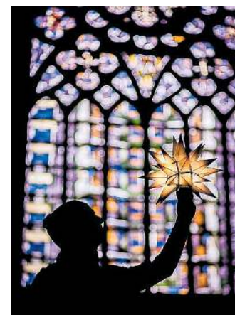
Der Stern erstrahlt vor bunten Fenstern.

Die ViertelSternStunde findet jeden Tag vom 1. bis 23. Dezember (außer am 7., 13. und 14.) immer von 18 bis 18:15 Uhr in der Stadtkirche St. Reinoldi statt.