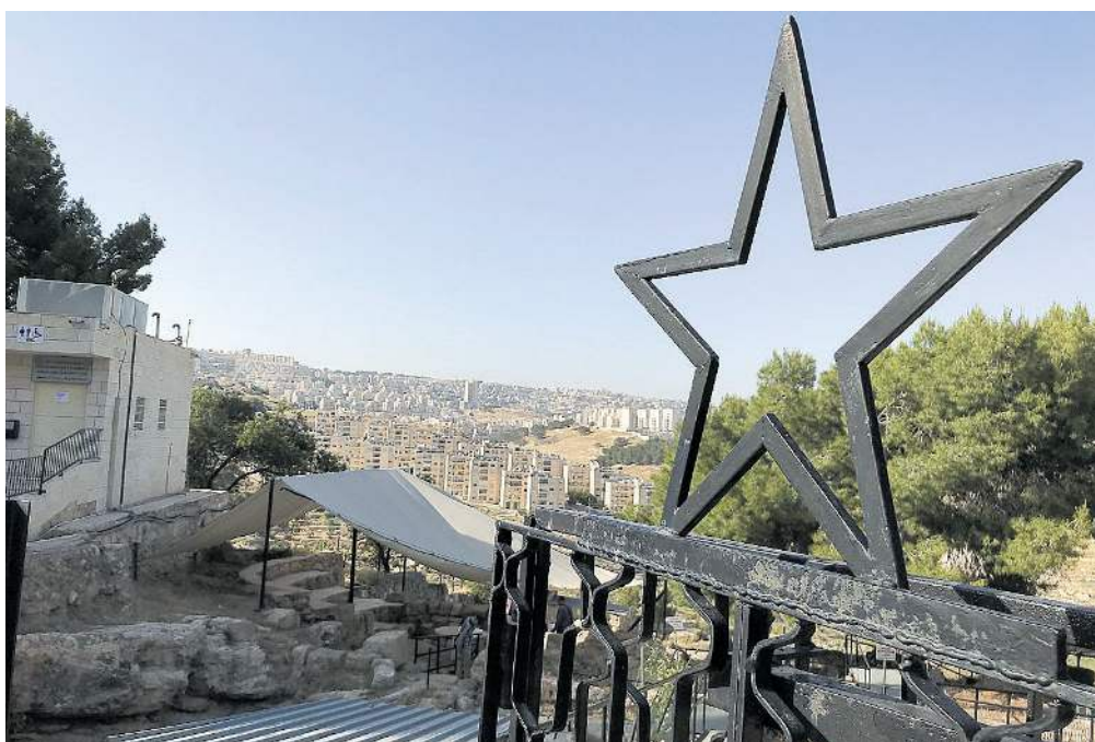
Weithin sichtbar ist der Stern über Shepherds' Field – den Hirtenfeldern.