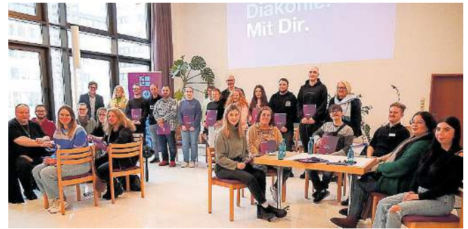
Mitarbeitende, die neu bei der Diakonie einsteigen, begrüßen Geschäftsführung und Mitarbeitervertretung mit einem Einführungstag.